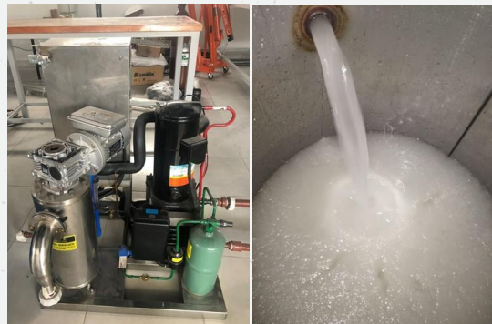
Prototipo desarrollado para la generación de pasta de hielo aplicado al enfriamiento de pescado.